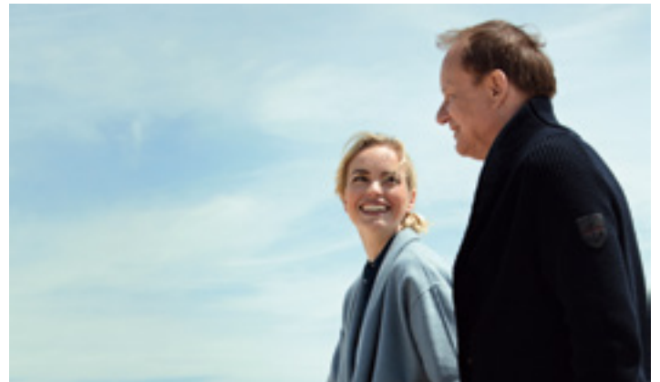
▲ „Rückkehr nach Montauk“ von Volker Schlöndorff