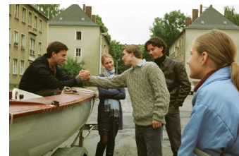
Go West - Freiheit um jeden Preis