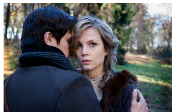
Das Mädchen und der Tod