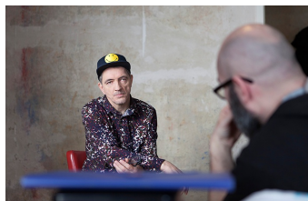
Der letzte Remix