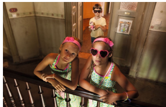
Rico, Oskar und das Herzgebroche