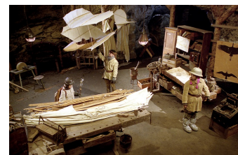
Stella und der Stern des Orients

Filmdatenbank der MDM www.mdm-online.de > Drehreport