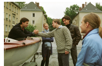
Go West - Freiheit um jeden Preis