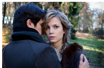
Das Mädchen und der Tod