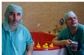
Der lange Weg ans Licht