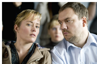
Über den Tod hinaus