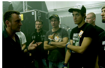
We are the Roadcrew