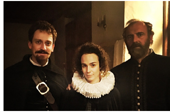
Die eiserne Zeit - Lieben und Töten im Dreißigjährigen Krieg