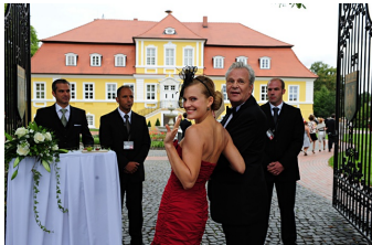
Mann tut was Mann kann