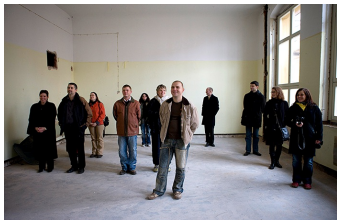
Heute war damals Zukunft