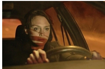
Die getäuschte Frau