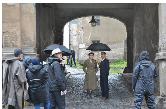
Auf Wiedersehen Deutschland