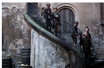
Die Vermessung der Welt