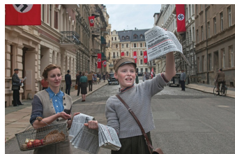
Jeder stirbt für sich allein