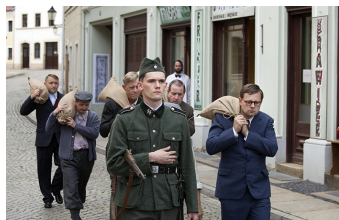
Zweiter Weltkrieg - Das erste Opfer