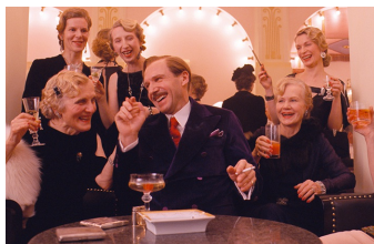
Grand Budapest Hotel