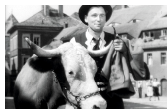
Der Ochse von Kulm

Liste von Dreharbeiten in der Stadt Görlitz www.goerlitz.de/Goerliwood-Filmografie.html