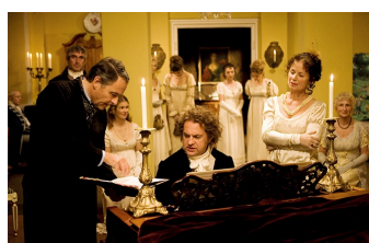
Giganten - Ludwig von Beethoven