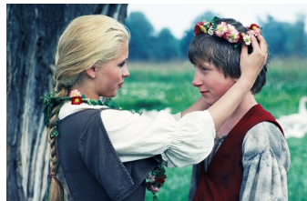
Die Geschichte von der Gänseprinzessin und ihrem treuen Pferd Falada