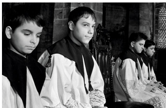
Engel im Fegefeuer