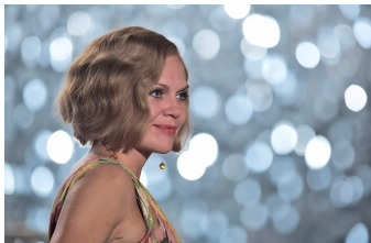
Nacht über Berlin