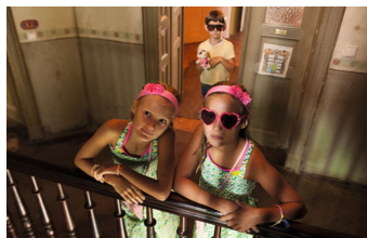
Rico, Oskar und das Herzgebroche