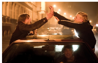
Als wir träumten