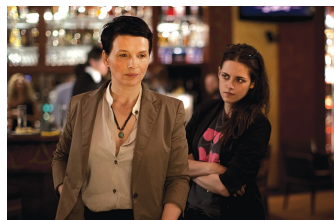
Die Wolken von Sils Maria