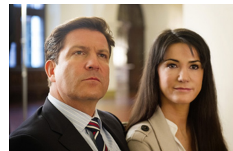
Ein Fall von Liebe