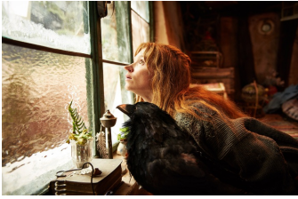
Die kleine Hexe