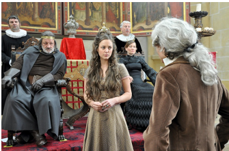
Der Teufel mit den drei goldenen Haaren