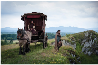
Der Medicus (Harsleben)