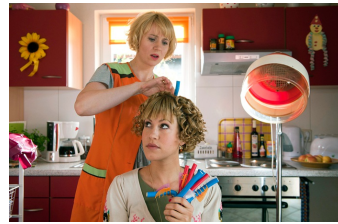
Heiter bis tödlich - Alles Klara