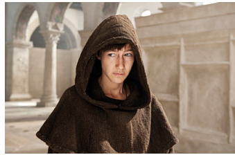
Die Päpstin (Gernrode, Harzgerode)