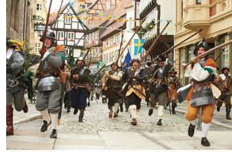
Das kleine Gespenst (Quedlinburg, Wernigerode)