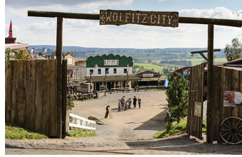
Winnetous Sohn (Halberstadt, Thale)