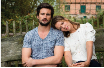
Stadlandliebe (Falkenstein, Quedlinburg)