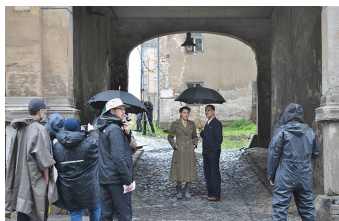
Auf Wiedersehen Deutschland