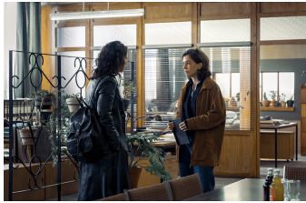
Die Quellen des Bösen – Jagd nach dem Runen-Mörder