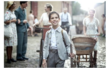
Lauf Junge Lauf (Zörbig)