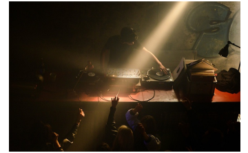
Als wir träumten