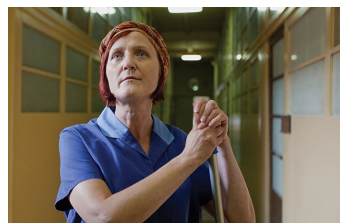
Damals nach der DDR