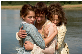
Die geliebten Schwestern (Coswig/Anhalt)