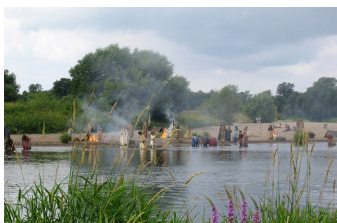
Kreuzzug in Jeans