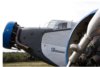
Bis zum Horizont, dann links