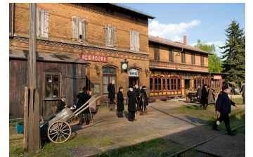
Ein russischer Sommer (Pretsch)