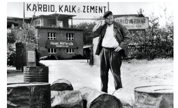
Karbid und Sauerampfer (DEFA 1963)

Filmdatenbank der MDM unter: www.mdm-online.de > Film Commission > Drehreport