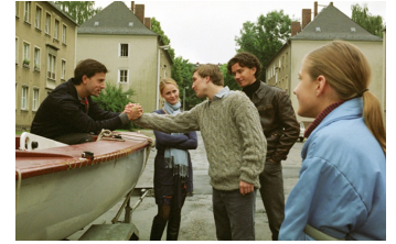
Go West - Freiheit um jeden Preis