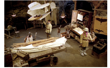
Stella und der Stern des Orients

Filmdatenbank der MDM www.mdm-online.de > Drehreport