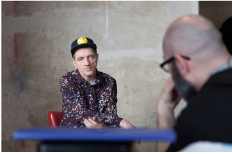
Der letzte Remix