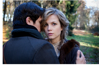
Das Mädchen und der Tod