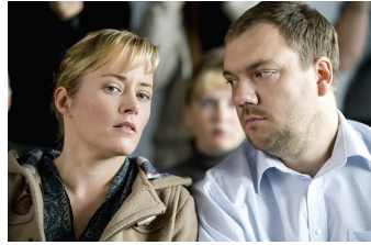
Über den Tod hinaus