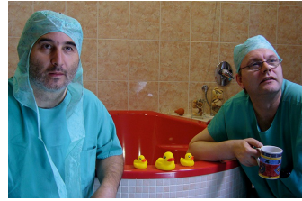
Der lange Weg ans Licht