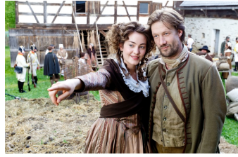
Geschichte Mitteldeutschlands: Karl Stülpner