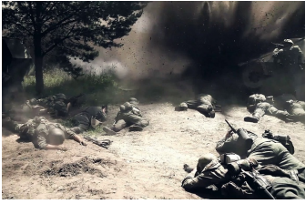
Wir waren Kameraden - das Ende