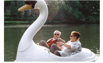
Der zweite Frühling

Filmdatenbank der MDM: www.mdm-online.de > Drehreport