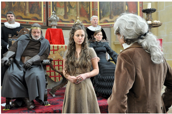
Der Teufel mit den drei goldenen Haaren