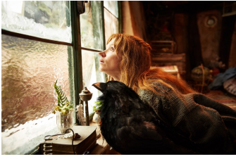
Die kleine Hexe