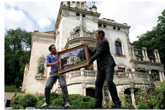
Wie erziehe ich meine Eltern