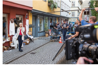
In aller Freundschaft – Die jungen Ärzte