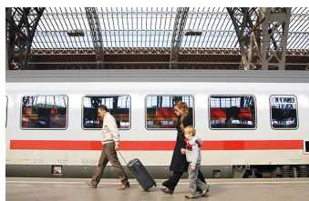
Circles | Kreise