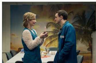
In den Gängen