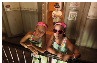
Rico, Oskar und das Herzgebroche