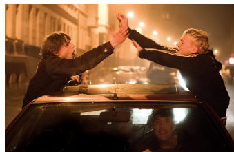
Als wir träumten