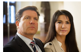
Ein Fall von Liebe