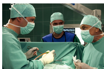
In aller Freundschaft