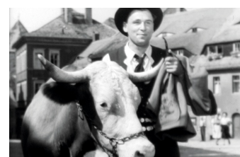
Der Ochse von Kulm

Liste von Dreharbeiten in der Stadt Görlitz www.goerlitz.de/Goerliwood-Filmografie.html