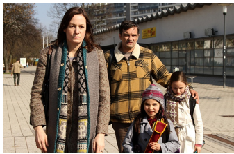
Circles | Kreise