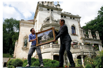
Wie erziehe ich meine Eltern