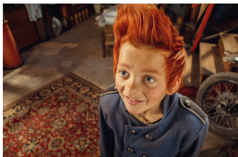
Doktor Proktors Puppulver