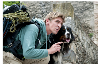
Löwenzahn – Das Kinoabenteuer