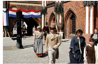
Napoleon und die Deutschen