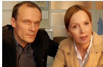
Jenseits der Mauer