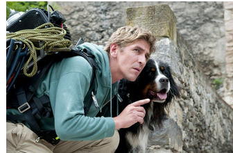
Löwenzahn – Das Kinoabenteuer