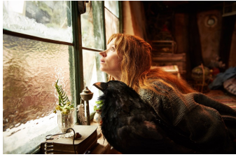
Die kleine Hexe