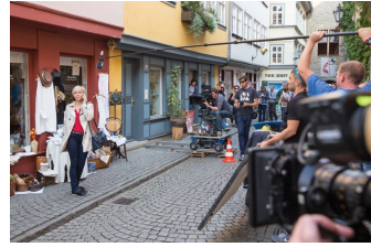
In aller Freundschaft – Die jungen Ärzte