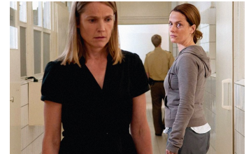
Das letzte Schweigen