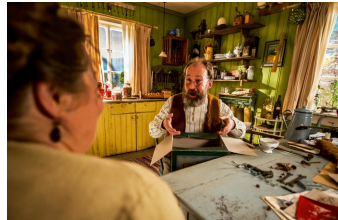
Petterson und Findus