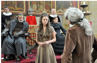
Der Teufel mit den drei goldenen Haaren