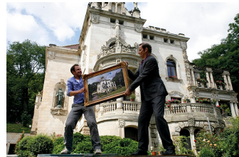
Wie erziehe ich meine Eltern