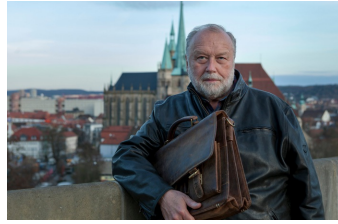
Der namenlose Tag