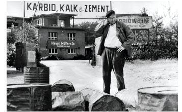
Karbid und Sauerampfer (DEFA 1963)

Filmdatenbank der MDM unter: www.mdm-online.de > Film Commission > Drehreport