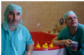
Der lange Weg ans Licht