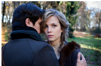
Das Mädchen und der Tod