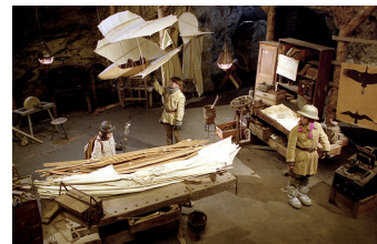
Stella und der Stern des Orients

Filmdatenbank der MDM www.mdm-online.de > Drehreport