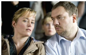
Über den Tod hinaus