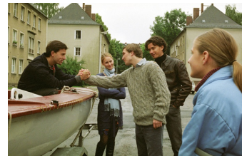
Go West - Freiheit um jeden Preis