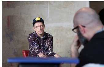
Der letzte Remix