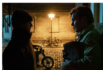
Die unheimliche Leichtigkeit der Revolution (Weißenfels)