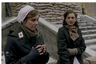
Unsere Mütter, unsere Väter (Zeitz)