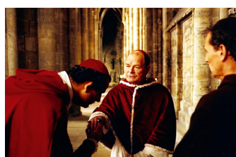
Die geheime Inquisition (Memleben, Schulpforte, Zeitz)