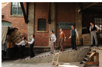
Es war einmal in Deutschland... (Weißenfels)