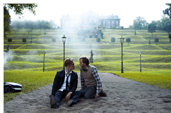
Der Nanny (Burgscheidungen)