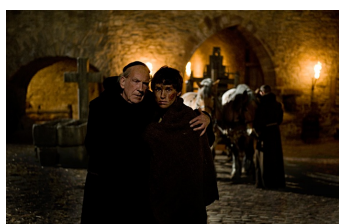
Black Death (Goseck)