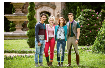
Bibi und Tina - Voll verhext (Vitzenburg)