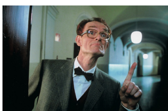
Das fliegende Klassenzimmer (Schulpforte)