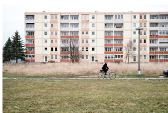
Das Mädchen mit den goldenen Händen (Zeitz)