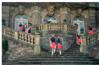
Hanni & Nanni - Mehr als beste Freunde (Burgscheidungen)