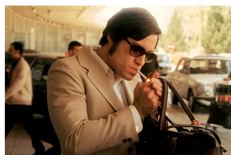
Carlos - Der Schakal (Naumburg)