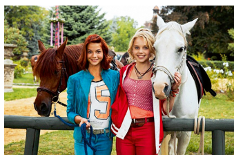
Bibi und Tina - Der Film (Vitzenburg)