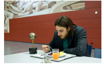
Die Einsamkeit der Primzahlen