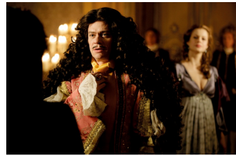
Mätressen – Die geheime Macht der Frauen