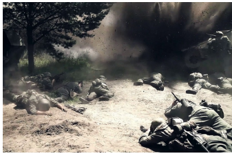
Wir waren Kameraden - das Ende