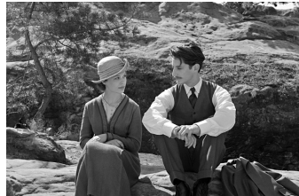
Frantz (Quedlinburg, Wernigerode)