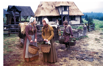
Schneeweißchen und Rosenrot (DEFA 1979)

Filmdatenbank der MDM unter: www.mdm-online.de > Film Commission > Drehreport