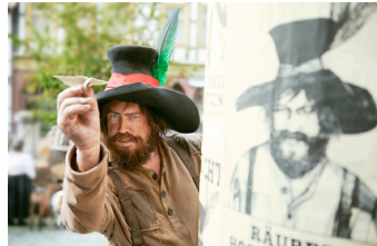
Der Räuber Hotzenplotz (Blankenburg, Quedlinburg, Langenstein)