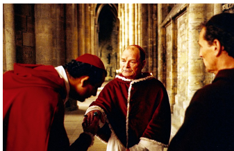
Die geheime Inquisition (Falkenstein, Gernrode, Halberstadt)