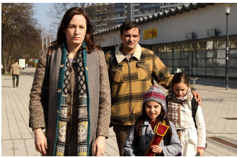
Circles | Kreise