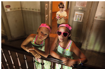
Rico, Oskar und das Herzgebroche