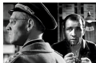
Nackt unter Wölfen

Film Datenbank der MDM unter www.mdm-online.de > Drehreport