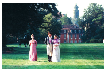
Lotte in Weimar