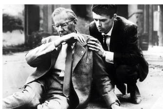
Denk bloß nicht, ich heule