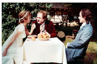
Hälfte des Lebens