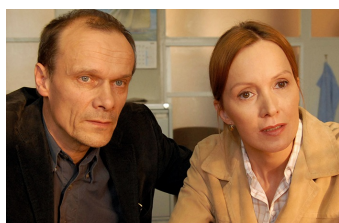
Jenseits der Mauer