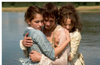
Die geliebten Schwestern