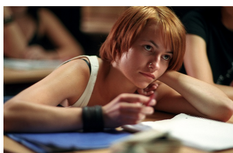
Meer Is Nich