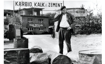
Karbid und Sauerampfer (DEFA 1963)

Filmdatenbank der MDM unter: www.mdm-online.de > Film Commission > Drehreport