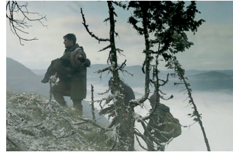
Judgment - Grenze der Hoffnung