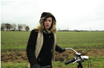
Die Zeit nach der Trauer