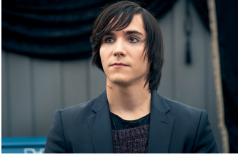
Besser als nix