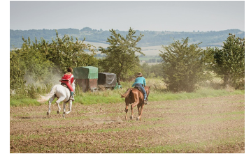
Bibi und Tina - Voll verhext (Blankenburg, Thale)