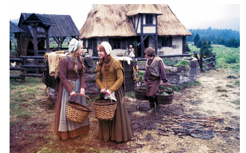
Schneeweißchen und Rosenrot (DEFA 1979)

Filmdatenbank der MDM unter: www.mdm-online.de > Film Commission > Drehreport