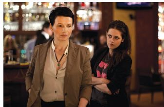
Die Wolken von Sils Maria