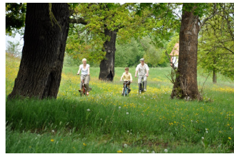
Als wir die Zukunft waren