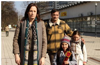
Circles | Kreise