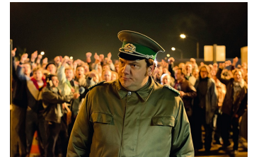
Bornholmer Straße (Wanzleben)