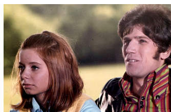
Du und ich und Klein-Paris