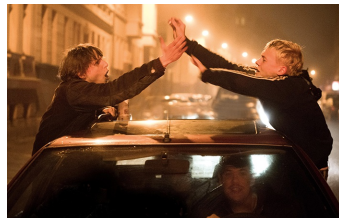
Als wir träumten