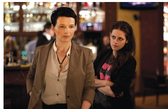
Die Wolken von Sils Maria