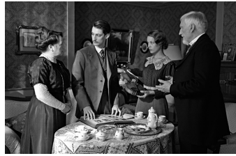
Frantz (Blankenburg, Friedrichsbrunn)