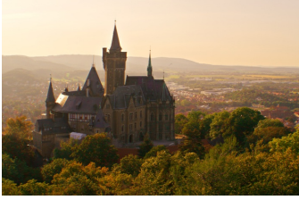
Die Schule der magischen Tiere 2 und 3