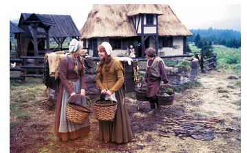
Schneeweißchen und Rosenrot (DEFA 1979)

Filmdatenbank der MDM unter: www.mdm-online.de > Film Commission > Drehreport