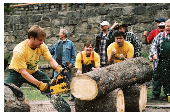
Die Könige der Nutzholzgewinnung