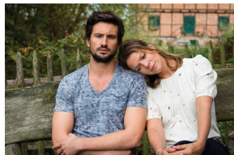
Stadtlandliebe (Blankenburg, Thale)