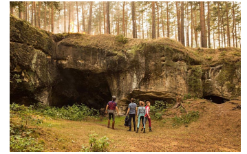
Bibi und Tina - Mädchen gegen Jungs (Blankenburg, Rübeland, Thale)