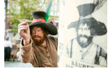
Der Räuber Hotzenplotz (Blankenburg)