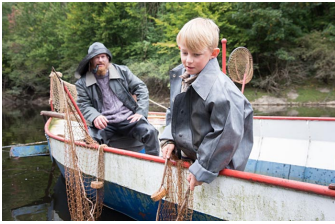
Der Krieg und ich - Kindheit im Zweiten Weltkrieg (Blankenburg, Thale)