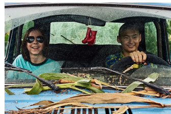
Tschick (Blankenburg, Thale)