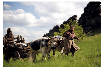
Black Death (Blankenburg, Thale)