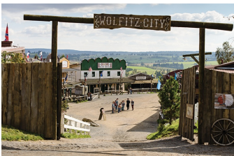
Winnetous Sohn (Blankenburg, Hasselfelde, Thale)