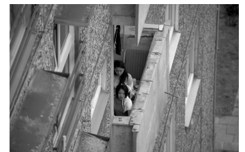
Wir sind jung. Wir sind stark.