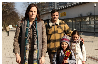
Circles | Kreise