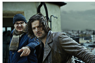
Zorn - Tod und Regen