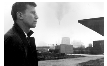
Der geteilte Himmel

Filmdatenbank der MDM unter www.mdm-online.de > Film Commission > Drehreport Informationen zum aktuellen Drehgeschehen unter www.mdm-online.de > Film Commission > Produktionsspiegel Trailer Infomagazin der MDM: www.mdm-online.de > Startseite > Aktuelles > Infomagazin Trailer