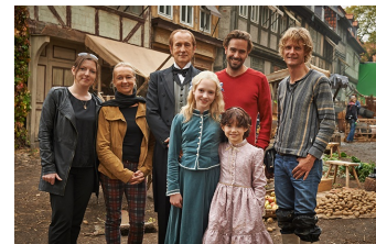
Heidi (Halberstadt, Quedlinburg)