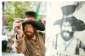
Der Räuber Hotzenplotz (Blankenburg, Quedlinburg, Langenstein)