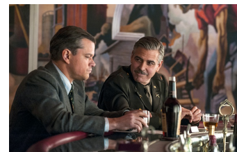
The Monuments Men (Halberstadt, Osterwieck)