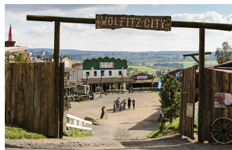
Winnetous Sohn (Halberstadt, Thale)