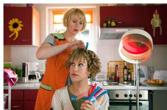
Heiter bis tödlich - Alles Klara