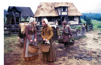
Schneeweißchen und Rosenrot (DEFA 1979)

Filmdatenbank der MDM unter: www.mdm-online.de > Film Commission > Drehreport