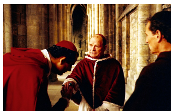
Die geheime Inquisition (Falkenstein, Gernrode, Halberstadt)