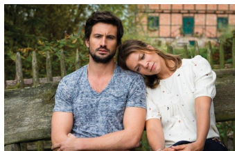
Stadlandliebe (Falkenstein, Quedlinburg)