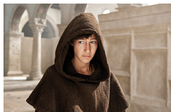
Die Päpstin (Gernrode, Harzgerode)