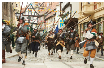
Das kleine Gespenst (Quedlinburg, Wernigerode)