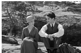
Frantz (Quedlinburg, Wernigerode)