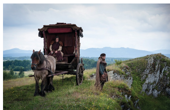
Der Medicus (Harsleben)