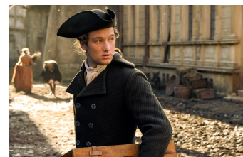
Goethe! (Osterwieck, Quedlinburg)