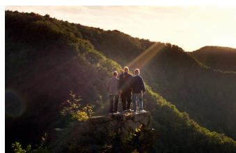
Wenn die Welt uns gehört (Halberstadt)