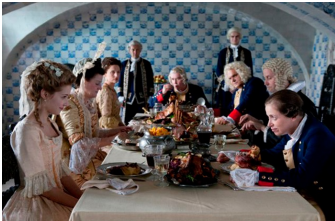
Friedrich - Ein deutscher König (Oranienbaum)