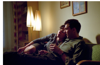
Hunger auf Leben (Bitterfeld)