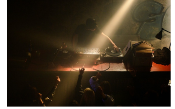
Als wir träumten