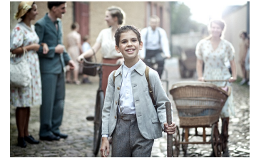
Lauf Junge Lauf (Zörbig)