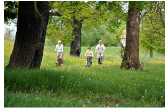
Als wir die Zukunft waren