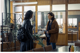
Die Quellen des Bösen – Jagd nach dem Runen-Mörder