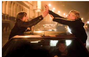
Als wir träumten