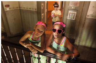
Rico, Oskar und das Herzgebroche