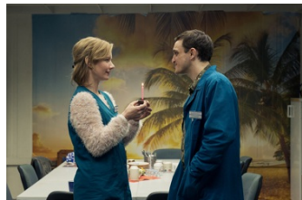
In den Gängen