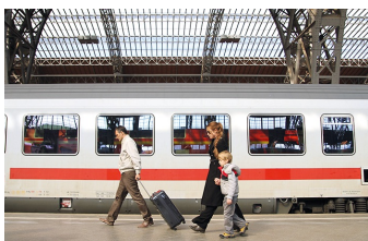
Circles | Kreise