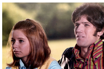
Du und ich und Klein-Paris