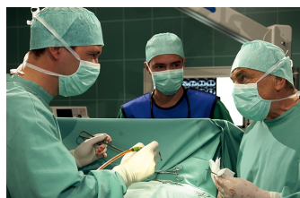
In aller Freundschaft