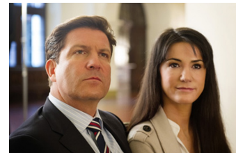
Ein Fall von Liebe