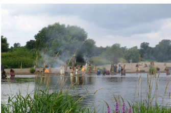
Kreuzzug in Jeans