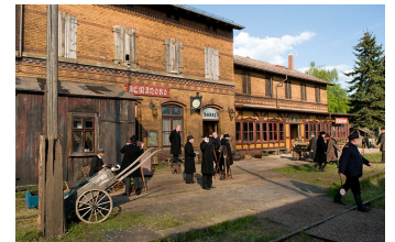
Ein russischer Sommer (Pretsch)