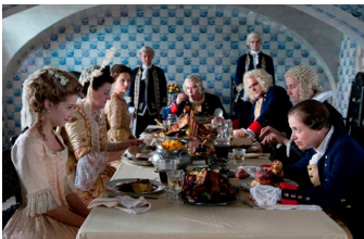
Friedrich - Ein deutscher König (Oranienbaum)