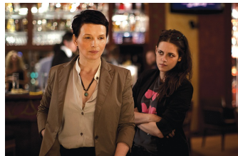
Die Wolken von Sils Maria