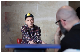
Der letzte Remix