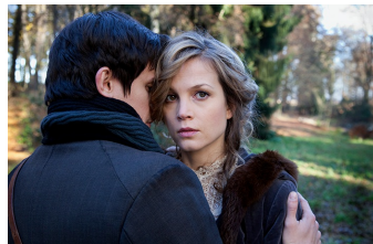
Das Mädchen und der Tod