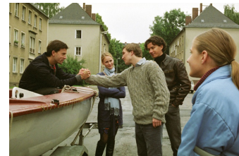
Go West - Freiheit um jeden Preis