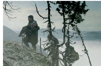
Judgment - Grenze der Hoffnung