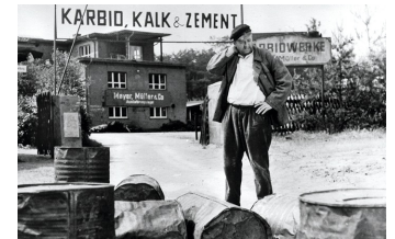
Karbid und Sauerampfer (DEFA 1963)

Filmdatenbank der MDM unter: www.mdm-online.de > Film Commission > Drehreport