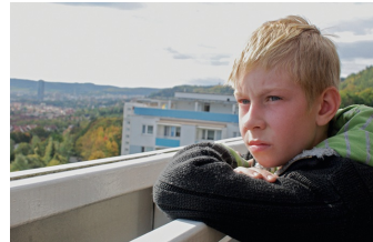
Das verlorene Lachen