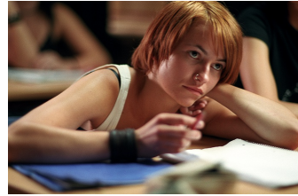
Meer is nich