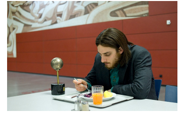
Die Einsamkeit der Primzahlen